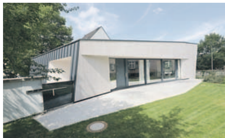
Das neue Gemeindehaus der Martinusgemeinde in Schwanheim.

Bauunterhalt ist teuer. Deshalb gibt es in der evangelischen Kirche Richtlinien dafür, wie viel Fläche einer Gemeinde je nach Mitgliederzahlen zusteht. Vor zehn Jahren war diese in Frankfurt mehr als doppelt so groß wie vorgesehen – weshalb die Gemeinden aufgefordert wurden, sich zu verkleinern. „Knapp vierzig Prozent haben sich