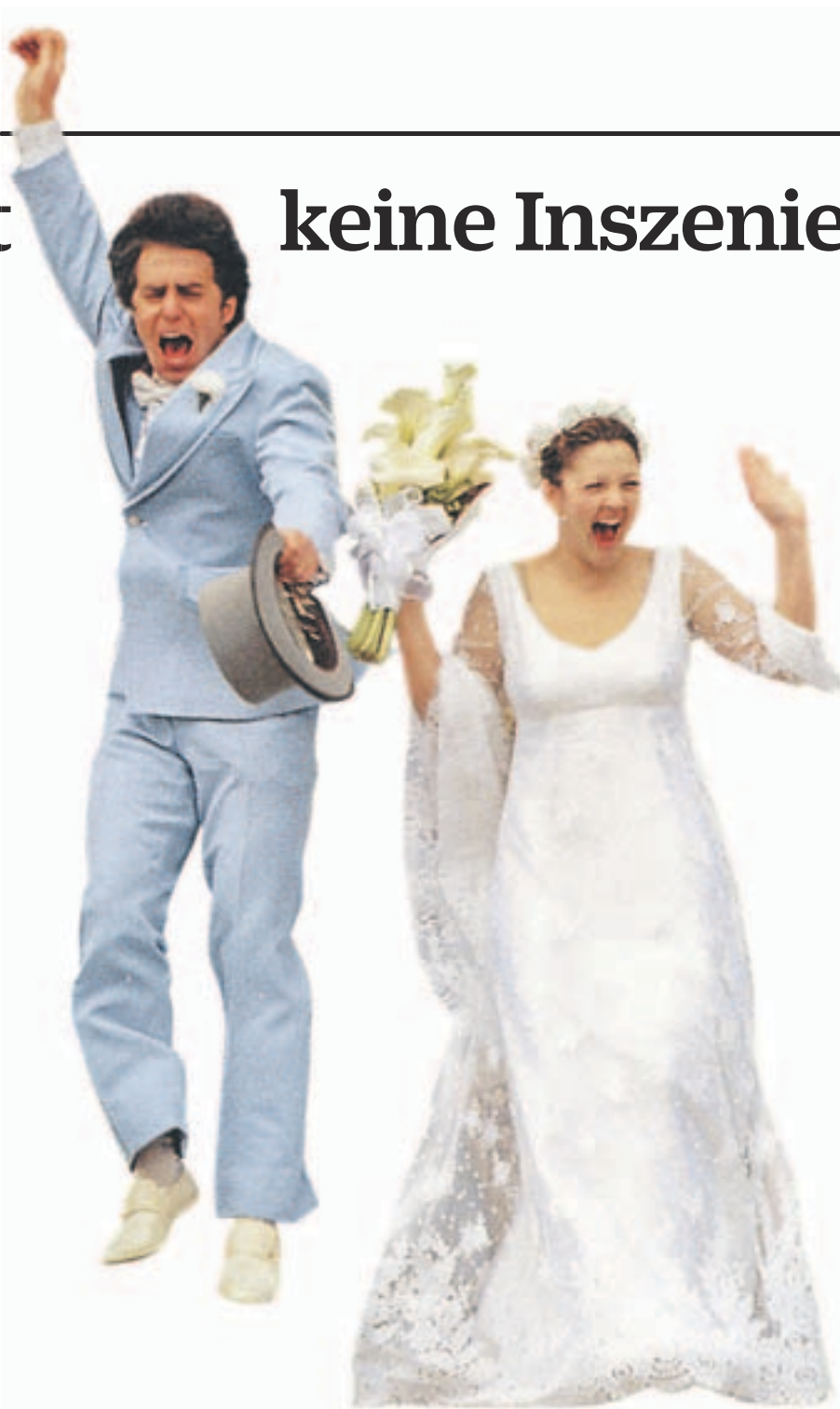
Sam Rockwell und Drew Barrymore in einer Szene aus dem Film „Geständnisse“.