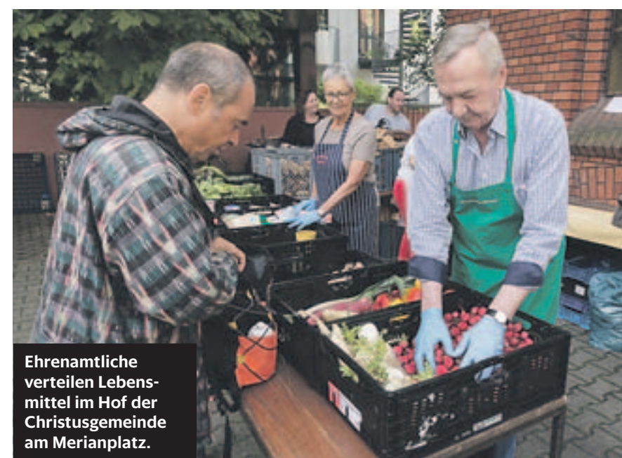
Ehrenamtliche verteilen Lebensmittel im Hof der Christusgemeinde am Merianplatz.

ner 2012 gegründeten bundesweiten Initiative zur „Rettung“ von Lebensmitteln. Über die Internet-Plattform food-sharing.de vernetzen sich Menschen auch in Frankfurt, um Lebensmittel, die sonst weggeworfen würden, zu verteilen und weiter zu verwenden.