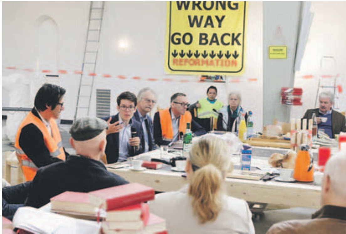
Die Epiphaniaskirche als Baustelle: Kunst und Tischgespräche zur Reformation.

Aber am Wichtigsten ist und bleibt natürlich, dass man sich überhaupt grüßt.