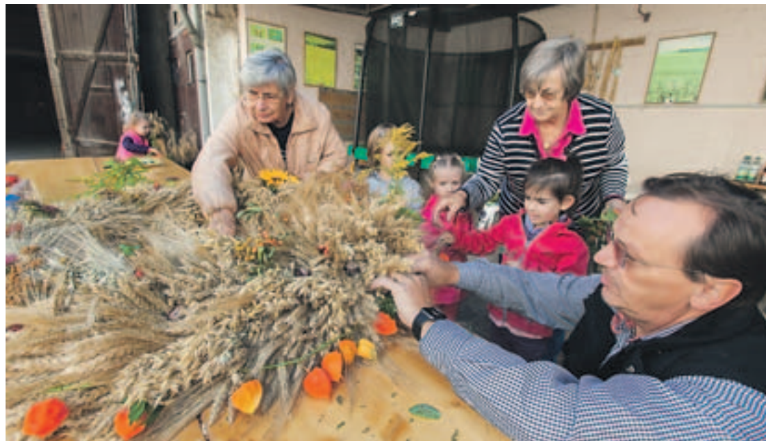
Generationsübergreifendes Erntedank-Kranz-Binden, voriges Jahr in der Gemeinde Zeilsheim.